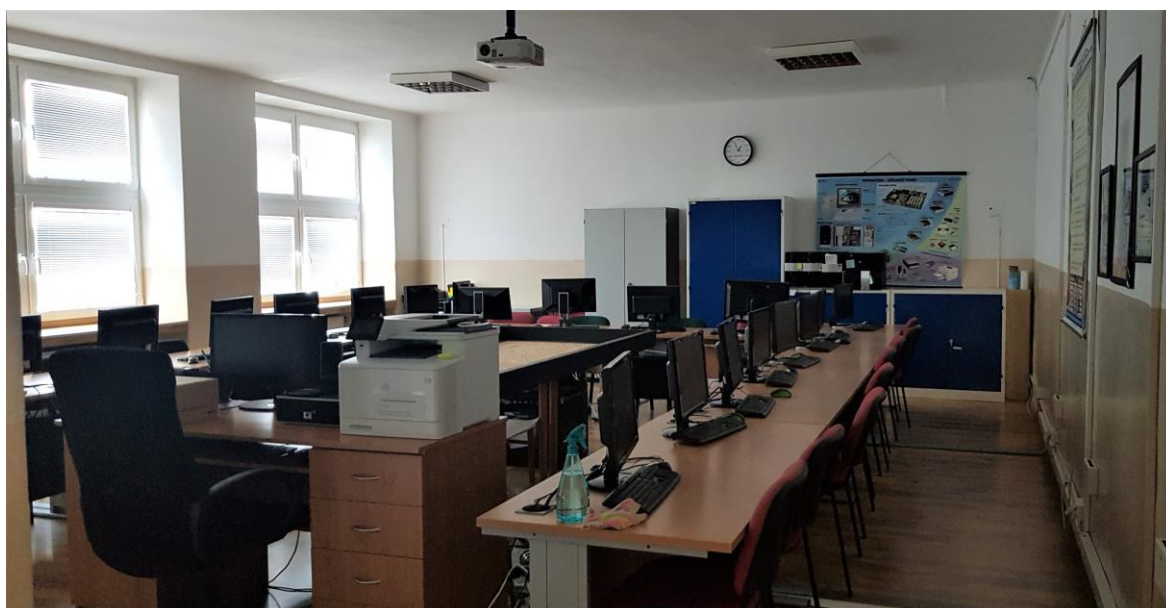
obr.4 odborná učebňa informatiky a jazyková učebňa s počítačom pre každého žiaka- 2021 – výmena všetkých PC za nové- výkonné z projektov (ČSOB, SK NIC 2020-2021- vid' projekty