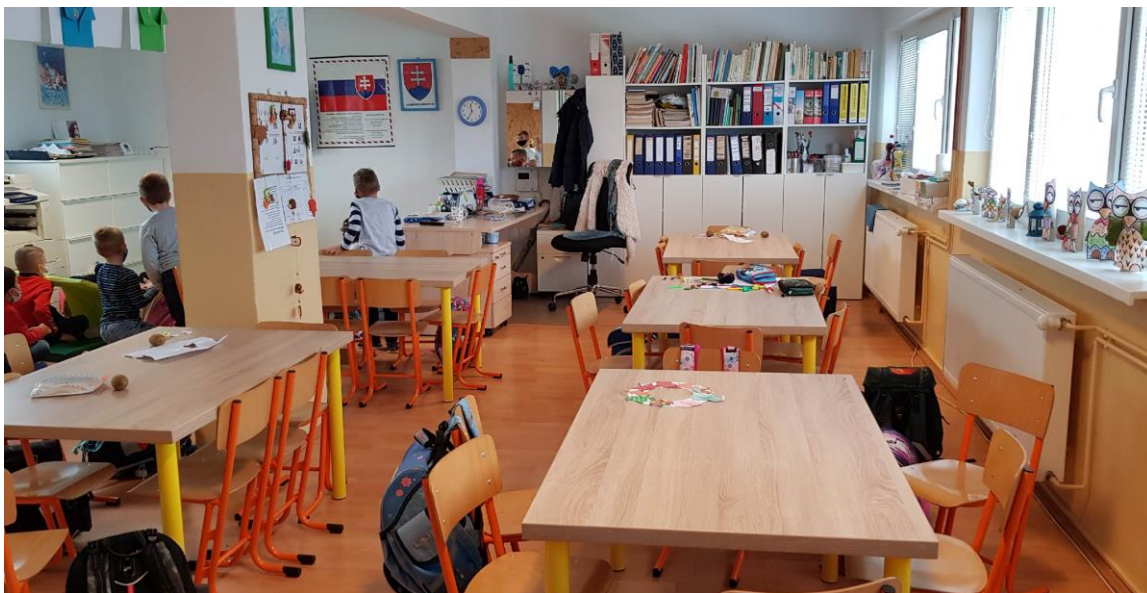
obr. 13 samostatne vyčlenené zmodernizované priestory na činnosť školského klubu detí s oddychovými aj edukačno-kreatívnymi zónami

Nové stoly v ŠKD, v pozadí nová tapetová stena proti zašpineniu