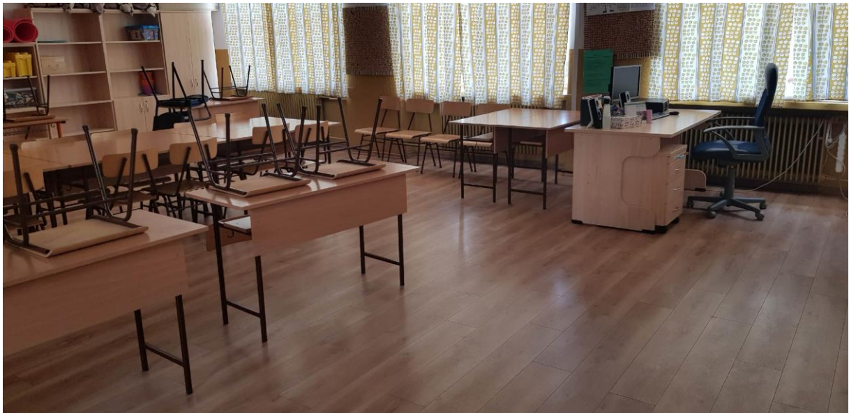
Obr. 8 Nové závesy vo všetkých triedach na zabezpečenie vyhovujúcich psychohygienických podmienok v triedach- júl 2020