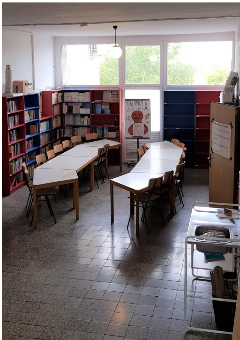
Obr.9 Zrekonštruovaná knižnica na: multifunkčnú učebňu pre predmety VYV, Kreatívne písanie a školskú knižnicu (apríl 2021) Nové stoly, pridaný radiátor, dovedená voda do výtvarného antikorového umývadla.