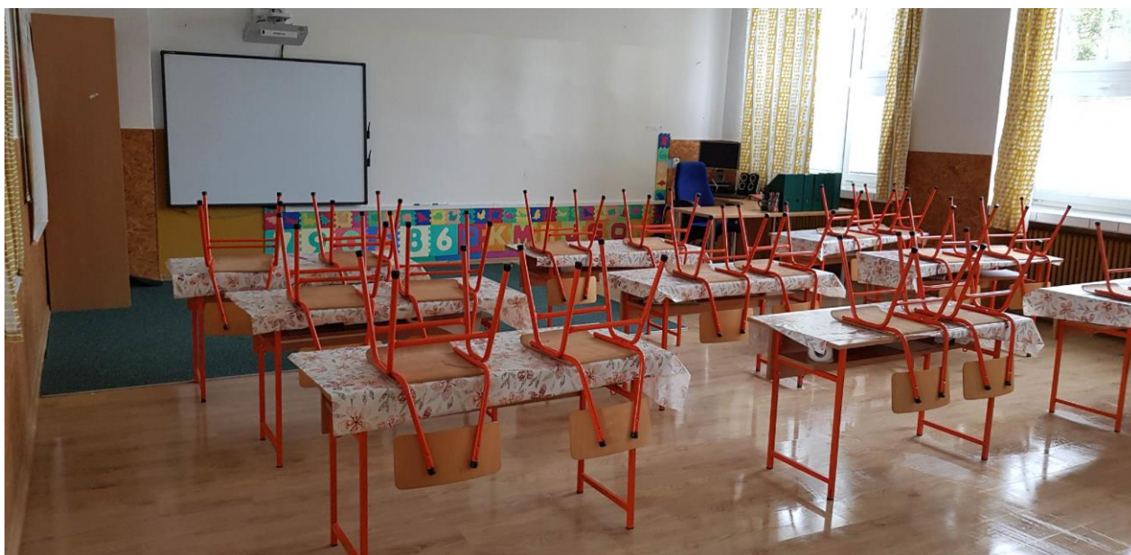
obr.3 1. a 2.trieda s rekonštruovanými Smart Wall Paint tabuľami pre 1.stupeň