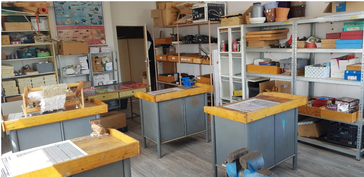
Obr. 6 upravená učebňa technickej výchovy apríl 2021/ nové náradie a regále /dar