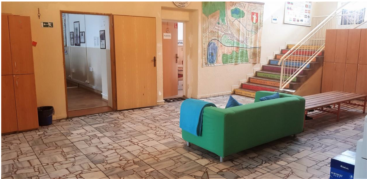
obr.10 -11 Oddychové zóny pre žiakov a nové edukačné nálepky na schodoch školy- máj 2021