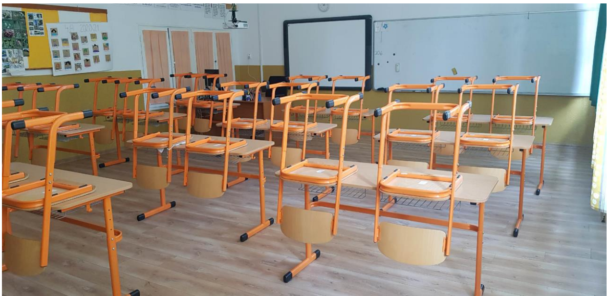
Obr.7 Nová laminátová podlaha v 4.A triede (2020)